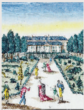
Vue du jardin des plantes

SALA CONFERENZE, VIA ARNALDO DA BRESCIA 22, ORE 18